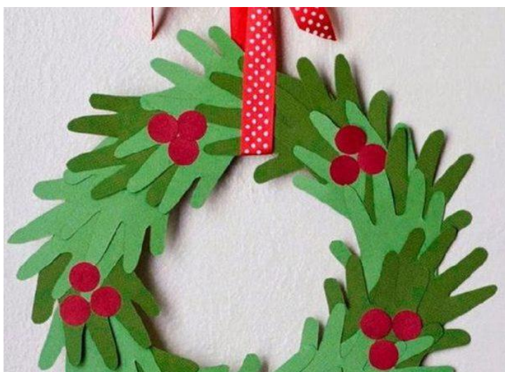
Okraski iz naravnih in odpadnih materialov: