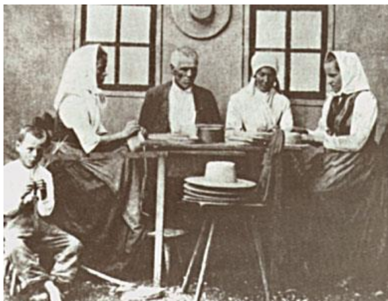
Slamnikarstvo v Domžalah. Deček na levi plete kito iz slame.