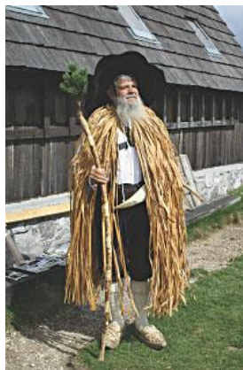
Stara pastirska noša na Veliki