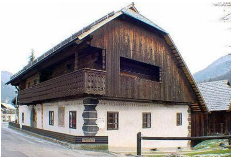
Gorenjska kmečka hiša

V alpskem in predalpskem svetu so se razvili različni tipi hiš. GORENJSKA HIŠA je imela zidano pritličje, zgornji del je bil lesen. Zgoraj je bil »gank« z lepo izrezljano ograjo. Okna so bila zamrežena. Streha je bila iz skodel .