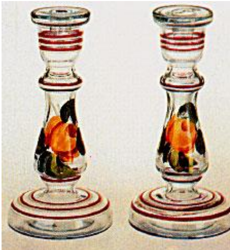
Svečnika iz pohorske steklarne

Za starejše STEKLARSTVO obstaja tudi izraz GLAŽUTARSTVO . Razvito je bilo na Pohorju, ker je bilo tu na razpolago veliko lesa. Tega so potrebovali za pridobitev oglja in surovine za izdelavo stekla.