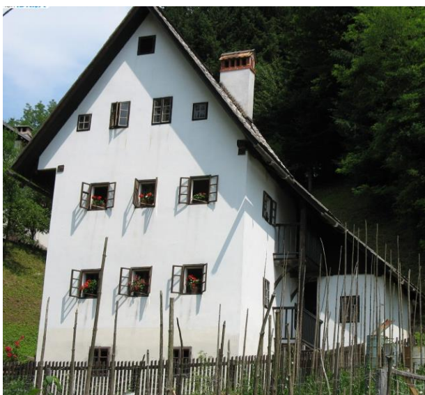
Rudarska hiša v Idriji

V rudarsko – fužinarskih hišah so stanovale družine rudarjev in kovačev, pogosto tudi po dve družini v eni sobi, brez kuhinj in kopalnic. Kuhali so na skupnih ognjiščih na hodnikih, kovači pa kar na delovnih mestih.