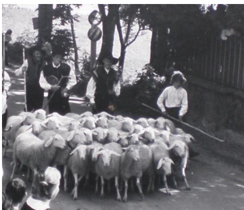
Prihod ovčarjev na ovčarski bal

Za vsako pokrajino so značilne določene ŠEGE IN NAVADE . Mnogo se jih je že izgubilo, zato danes nekatere ohranjamo kot turistične zanimivosti, da ne bi utonile v pozabo. Znana sta KRAVJI BAL V BOHINJU in OVČARSKI BAL NA JEZERSKEM , ki sta povezana z jesensko vrnitvijo čred s planinskih pašnikov. Ob teh priložnostih se spomnimo jedi, ki so bile nekoč v navadi, ali dejavnosti, povezanih na primer s prihodom ovc s planine, kot so striženje ovc, česanje in predenje ter pletenje volne.