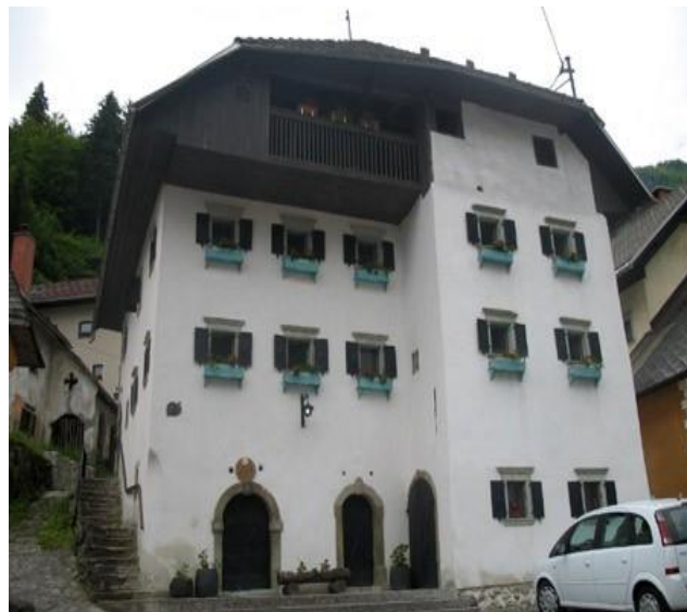
Fužinarska hiša v Kropi